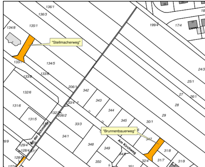
Grundlage des Übersichtsplanes: Auszug aus den Geobasisdaten der Niedersächsischen Vermessungs- und Katasterverwaltung – unmaßstäblich